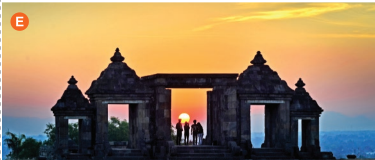
Sunset dari Alun-alun