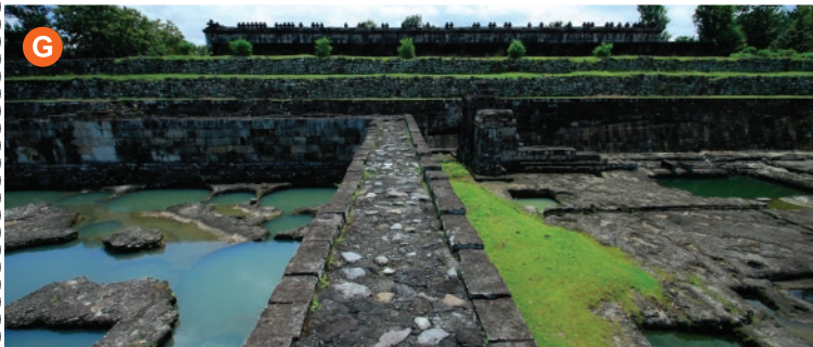
Pendopo dan kolam pemandian kuno