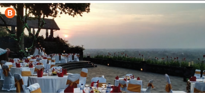
Ratu Boko Resto