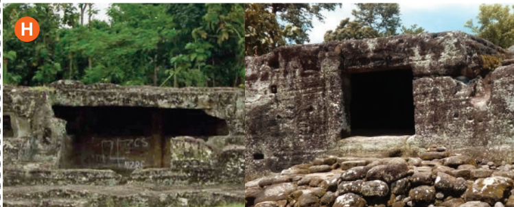
Goa Lanang & Goa Wadon