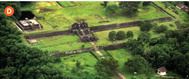
Foto udara taman Gapura Ratu Boko